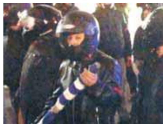
Μέλη του ΕΛΑΜ με ρόπαλα, κράνη και αυτοσχέδιες ασπίδες σε πορεία προς την πλατεία Φανερωμένης, 16/01/13.